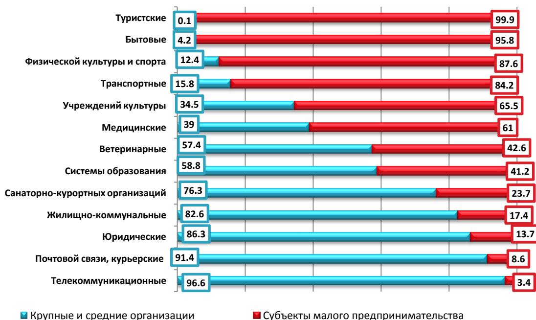
Структура формирования отдельных видов платных услуг населению по каналам реализации за 2018г.

нимателями. Спектр услуг, предоставляемых организациями малого предпринимательства, довольно разнообразен. Ведущее место занимают туристские, бытовые, транспортные услуги, а также услуги в области физической культуры и спорта.